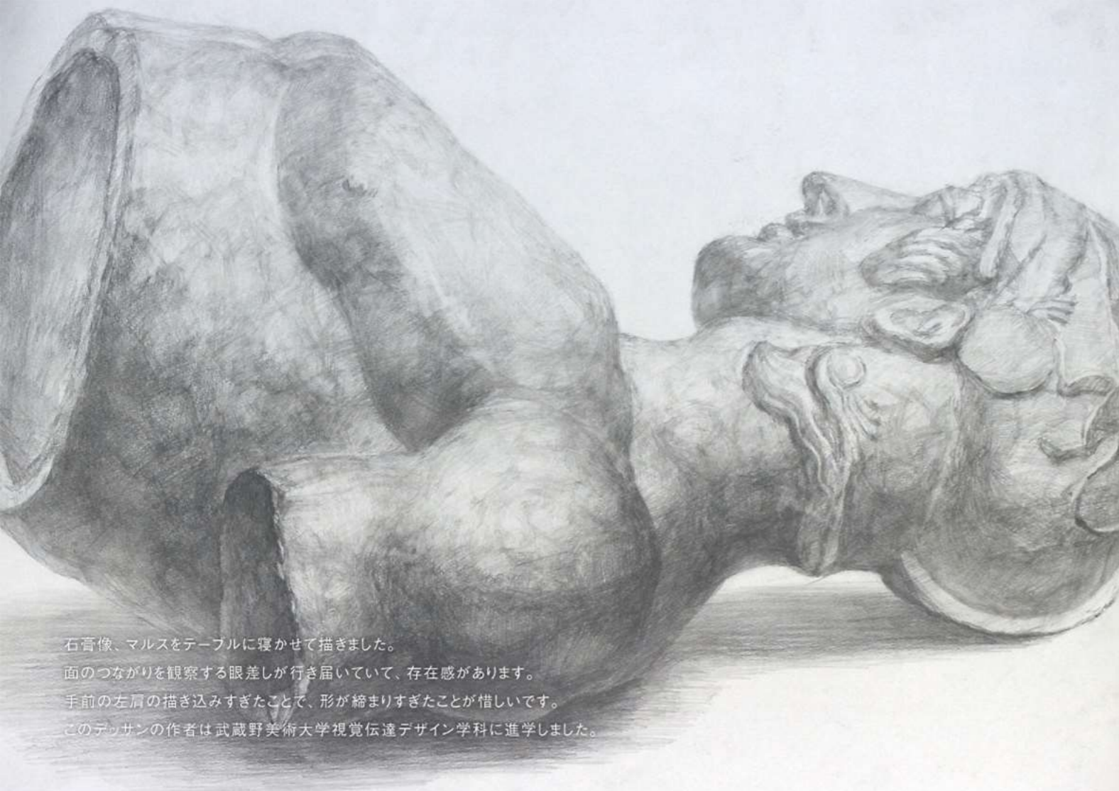
石膏像、マルスをテーブルに寝かせて描きました。 面のつながりを観察する眼差しが行き届いていて、存在感があります。 手前の左肩の描き込みすぎたことで、形が縮まりすぎたことが惜しいです。 このデッサンの作者は武蔵野美術大学視覚伝達デザイン学科に進学しました。